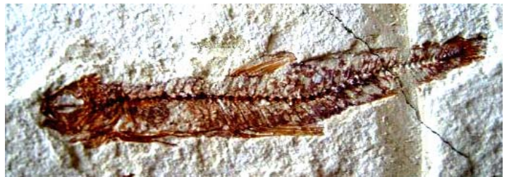
Bregmaceros albyi (Länge des Fisches: 4,3 cm)